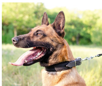
Photo: collier en cuir 25 mm de large avec doublure en feutre pour chiot et jeune chien