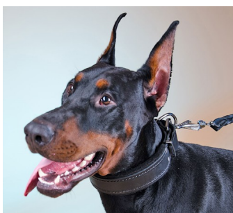
Photo: collier en cuir doublé de feutre large de 30 mm