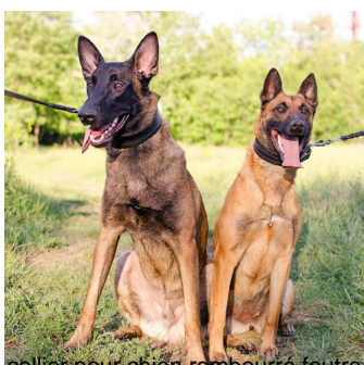
Photo: collier pour chien rembourré feutre 40 mm